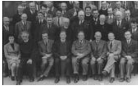
Op DIAS met o.a. Dirac en Schrödinger

Eén van de universiteiten die we gaan bezoeken is het Dublin Institute for Advanced Studies. Deze universiteit, in 1940 opgericht, is een geval apart. Wat jullie als wiskundigen en natuurkundigen in spe uiteraard zullen waarderen, is tweederde van de onderdelen van deze universiteit gericht op bètawetenschappen, en dan met name de natuur- en sterrenkunde.