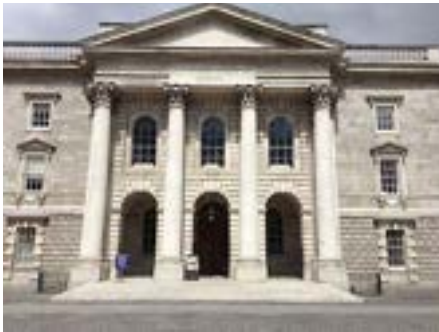
Buitenkant van de Trinity college kapel.

Trinity College is een universiteit in Dublin, opgericht in 1952 door Koning Elisabeth I. Het is de oudste universiteit van Ierland. De universiteit is in het bezit van een kapel en de grootste bibliotheek van heel Ierland.