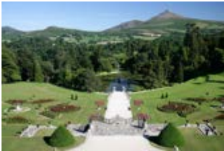
Powerscourt estate - gardens