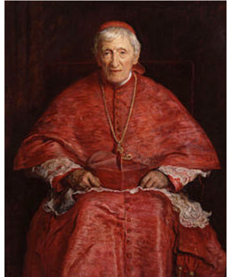
John Henry Newman

Het studentenleven op University College Dublin is goed, de universiteit is in bezit van studentenwoningen, verschillende sportclubs en zelfs een zwembad.