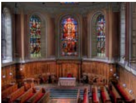
Binnenkant van de Trinity college kapel.

Het bekendste boekdeel uit de bibliotheek is The Book of Kells, een manuscript dat vier Evangelieën bevat uit het nieuwe testament.