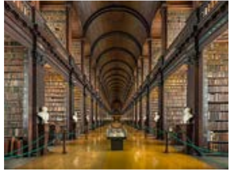
De oude bibliotheek.