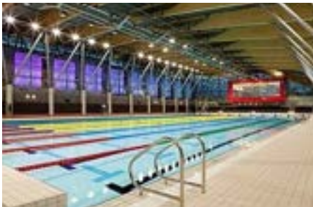
UCD 50 meter zwembad.

University College Dublin is een katholiek alternatief op Trinity college, een tegenbeweging op de godloze instituten zoals Belfast, Galway en Cork.