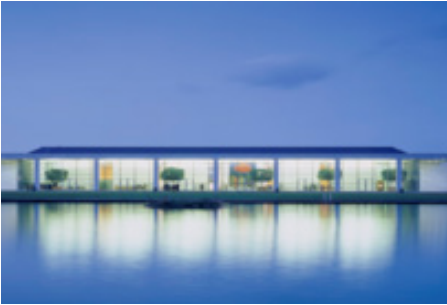
University College Dublin

Government Buidling, de formale locatie van UCD science and engineerings faculties, geopend door King George in 1905.