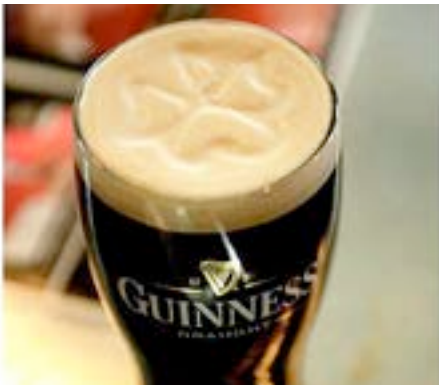
Klavertje vier getekent in de schuimlaag